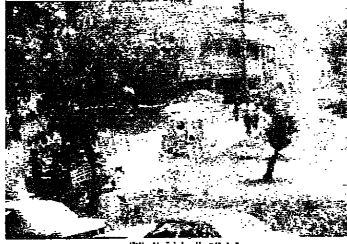
تمزيقات فلسطينية الى الاقليم